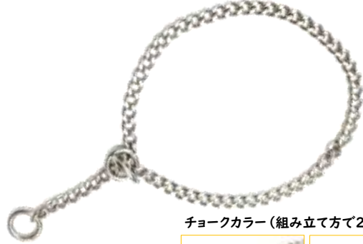
チョークカラー（組み立て方で2通りが可能）