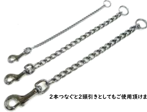
2本つなぐと2頭引きとしてもご使用頂けます。