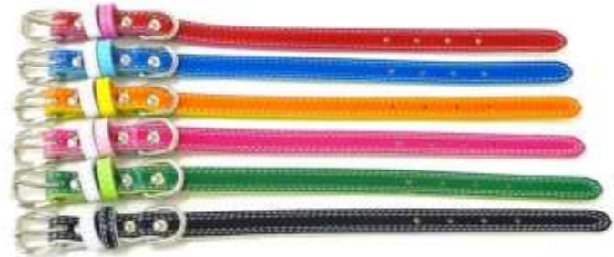
赤 (R) 青 (B) オレンジ (OR) ピンク (P) 緑 (G) 黒 (BK)