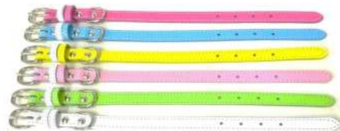
チェリー (CH) スカイ (SK) レモン (LE) ピーチ (PE) ライム (LI) ホワイト (WH)

当たり前のことですが、革は動物の皮膚でできており ワンちゃんたちの身体を覆う肌と同じものです。 肌荒れやアレルギーの防止にもなり、摩擦による 静電気が起きにくいので毛切れや、もつれ対策にもなります。