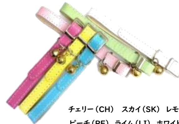
チェリー (CH) スカイ (SK) レモン (LE) ピーチ (PE) ライム (LI) ホワイト (WH)