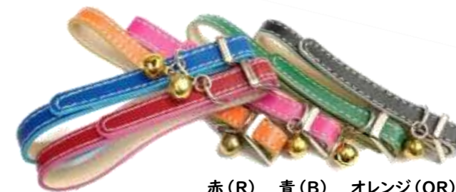
赤 (R) 青 (B) オレンジ (OR) ピンク (P) 緑 (G) 黒 (BK)