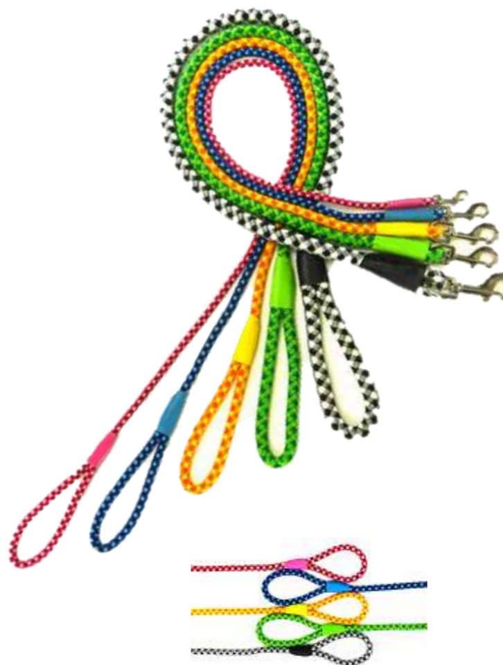
黒 (BK) 青 (B) 緑 (G) 赤 (R) 黄 (Y)