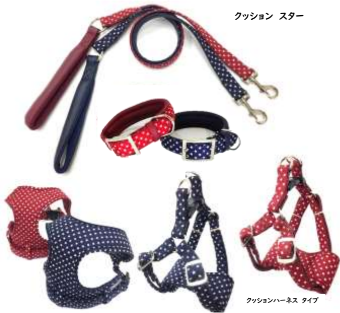
クッション スター