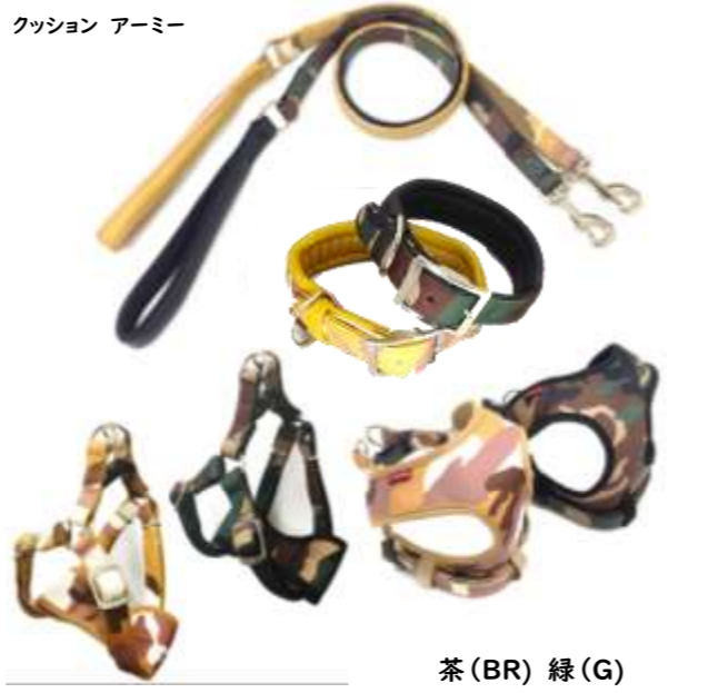
茶 (BR) 緑 (G)