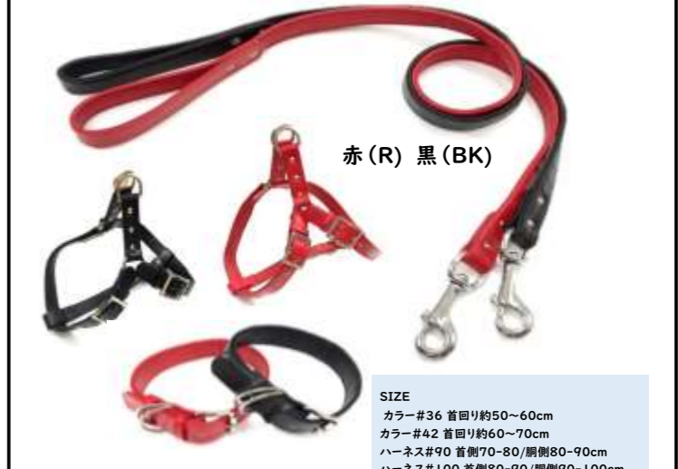
赤 (R) 黒 (BK)