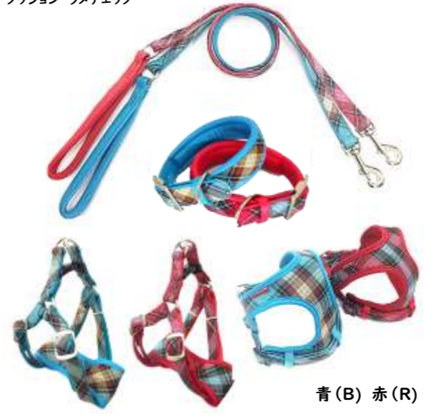
青 (B) 赤 (R)